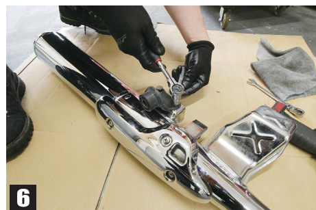
④純正マフラーのクランプを緩める ⑤タンデムステップのボルトを外す ⑥純正マフラーブラケットを取り外す