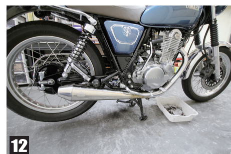
⑩ブラケットのナットを本締めする ⑪マフラーバンドを締める ⑫各部増し締めし完成です

※必ず全ての箇所において増し締めを行ってください ※装着後に違和感を感じる場合は直ちに使用を中止し検査を行ってください