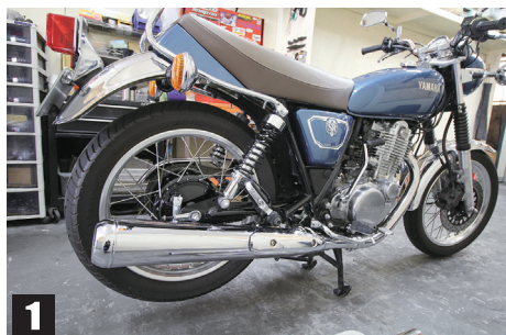
①センタースタンドがある場合は、センタースタンドを立てて作業を行う

この度はご購入いただき誠にありがとうございます 本製品の装着前に取り付け手順をご確認の上作業を行ってください