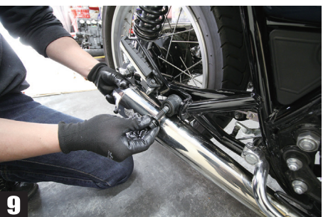
⑦テーパードコーンマフラーに純正マフラーブラケットを移設する ⑧エキパイに差し込む ⑨タンデムステップのボルトをセットする