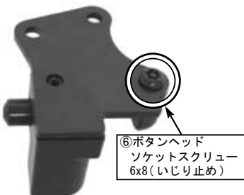
⑥ボタンヘッドソケットスクリュー 6x8（いじり止め）

⚠注意：必ず規定トルクを守る事。 ボタンヘッドスクリュー 6x8 トルク：8N・m（0.8kgf・m）