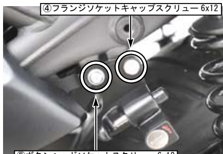
④フランジソケットキャップスクリュー 6x12

⚠注意：必ず規定トルクを守る事。 ④フランジソケットキャップスクリュー 6x12 ⑤ボタンヘッドソケットスクリュー 6x12 トルク：10N・m（1.0kgf・m）