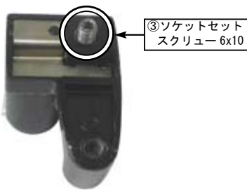
③ソケットセットスクリュー 6x10

⚠注意：必ず規定トルクを守る事。 ソケットセットスクリュー 6x10 トルク：1.5N・m（0.15kgf・m）