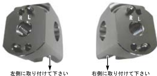
③ステップブラケットB L. ④ステップブラケットB R.

※左右で取り付ける部品が異なります。 L文字側にピンがある物を左側 R文字側にピンがある物を右側 } に取り付けして下さい。