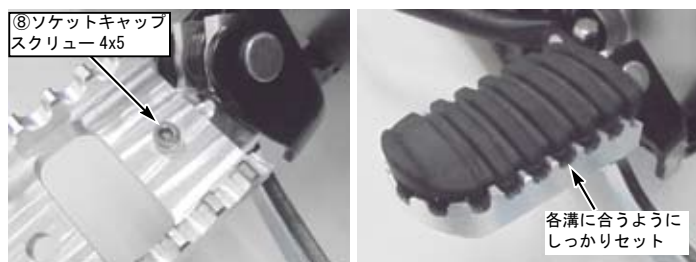
⑧ソケットキャップスクリュー 4x5

▲注意：必ず規定トルクを守る事。 ソケットキャップスクリュー 4x5 トルク：4N・m (0.4kgf・m) ソケットキャップスクリュー 6x10 トルク：9.8N・m (1.0kgf・m)