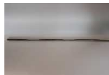
1330mmパイプ×2 (エンドキャップ付)