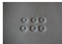
ジュラコンブッシュ×6