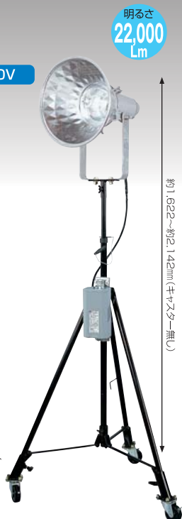
約1,622~約2,142mm (キャスター無し)