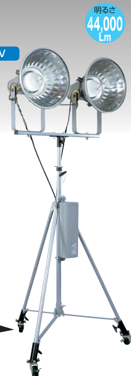
約1,767~約2,532mm (キャスター無し)

※注意事項につきましては、P.22をご覧ください。※明るさの目安につきましては、P.21をご覧ください。